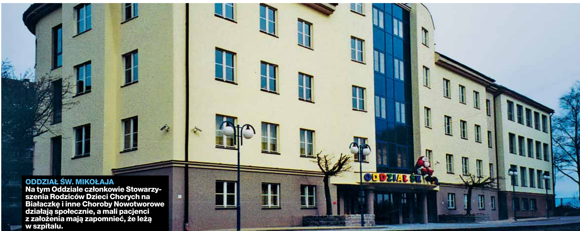
ODDZIAŁ ŚW. MIKOŁAJA Na tym Oddziale członkowie Stowarzyszenia Rodziców Dzieci Chorych na Białaczkę i inne Choroby Nowotworowe działają społecznie, a mali pacjenci z założenia mają zapomnieć, że leżą w szpitalu.

Mediaplanet jest wiodącym domem wydawniczym na rynku europejskim. Specjalizujemy się w tworzeniu wysokiej jakości publikacji tematycznych w prasie codziennej, online oraz broadcast. Mediaplanet nie ponosi odpowiedzialności za treść reklam.