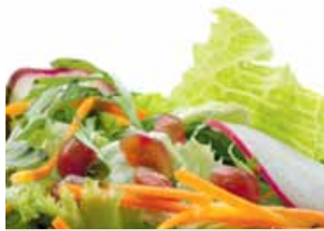
NIEDOBÓR WITAMIN Zdrowa dieta to nie wszystko. Należy wspomóc rozwój najmłodszych odpowiednią dawką suplementów codziennie.

Smutna prawda naszych czasów jest taka, że chociaż mamy w bród żywności to odznacza się ona niską jakością. Nie dotyczy to wcale tylko żywności z hipermarketów. Mięso, wędliny, nabiał w procesie masowej produkcji są przetwarzane, zanieczyszczane, często dodaje się do nich sztucznych polepszaczy. Możemy powiedzieć, że to „żywność identyczna z naturalną”, ale nie mająca z naturą już wiele wspólnego. Co więcej, spada jakość owoców i warzyw, np. w jabłkach odnotowuje się o 50-60% mniej witaminy C niż kiedyś, a w uchodzącym za kwintesencję zdrowia szpinaku nawet o 70% mniej magnezu. To konsekwencja wyjąłowania gleby i zanieczyszczania jej metalami ciężkimi i ołowiem. Żywność staje się też uboższa w trakcie zamrażania, przechowywania, smażenia, gotowania i chemicznego